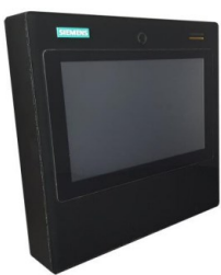
z. B. von Siemens,